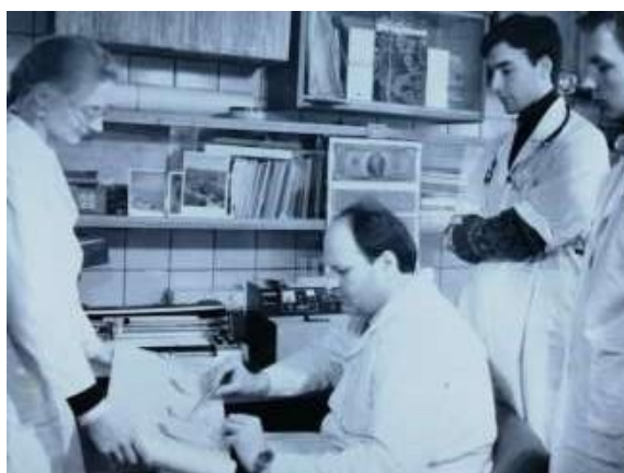
Исследование гемостаза на коагулометре. Исследование на агрегометре агрегации тромбоцитов.