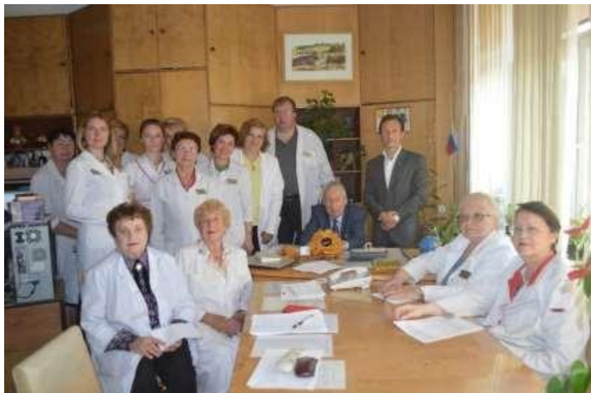
Коллектив кафедры факультетской терапии и профболезней МГМСУ им. И.М. Сеченова. 2019 год. Юбилей кафедры. 50 лет