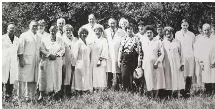
Коллектив кафедры внутренних болезней №3. 1973г.