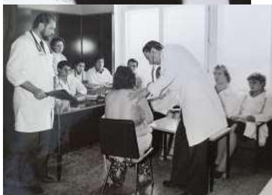
Рабочие будни кафедры факультетской терапии и профболезней.