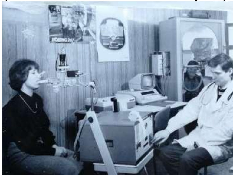
Проведение функциональной диагностики легких на аппарате «Бодискрин»

пульмонологии у больных сахарным диабетом. Защитил в 2009 г. докторскую диссертацию на тему – «Метаболизм и физическая работоспособность у больных сахарным диабетом 1-го типа. Место защиты: ГОУВПО "Московский государственный медико-стоматологический университет".